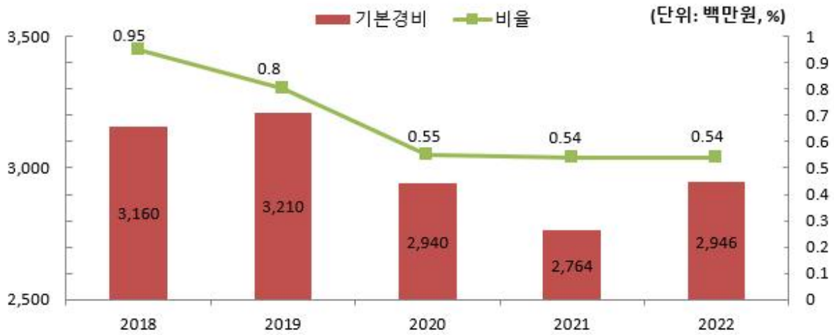
기본경비 연도별 변화